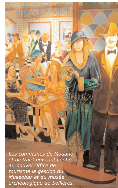
Les communes de Modane et de Val-Cenis ont confié au nouvel Office de tourisme la gestion du Museobar et du musée archéologique de Sollières.