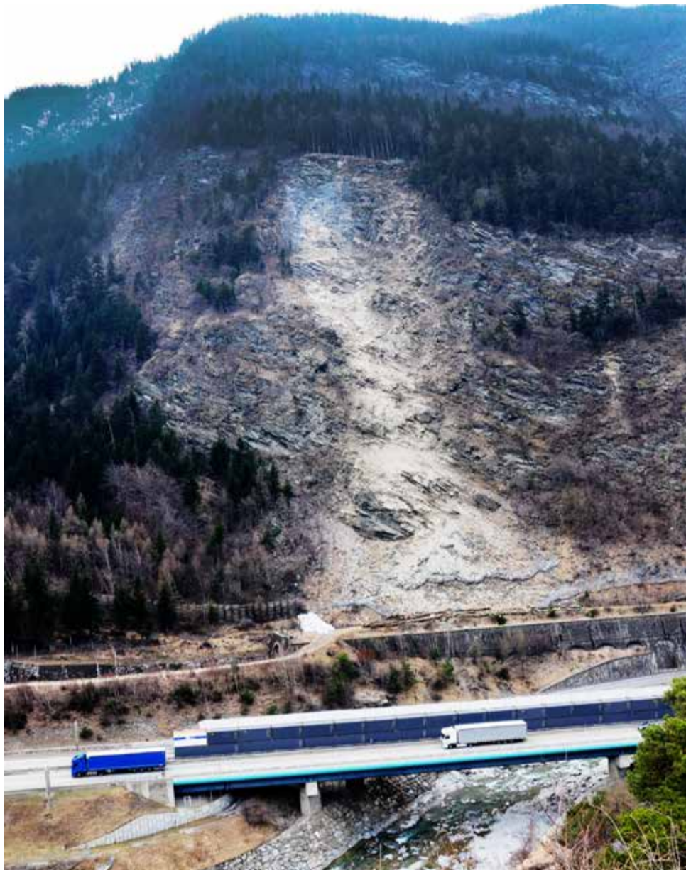
L'éboulement au Freney, sur la RD1006... Mais tous les changements apparaissant dans notre environnement montagnard ne sont pas aussi violents, certains sont à peine perceptibles et pourtant bien réels et intéressent l'analyse des chercheurs.

Pour accéder à l'enquête, taper dans Google : « montagne magazine témoignez des changements en montagne et sur l'évolution des pratiques »