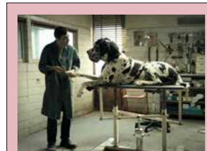
Dogman (interdit - 12 ans) 1h42 Mercredi 26 sept à 20h30