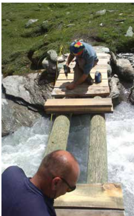
C'est presque terminé...