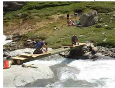
Les équipes de la CCHMV à pied d'œuvre.