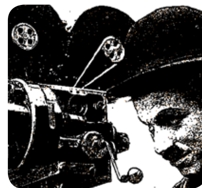
« Le cinéma est fait pour tous ceux dont la curiosité est le plus grand défaut. » Claude Lelouch Cinéaste

20h30, Guy . Mardi 18 sept , 20h30, L'homme qui tua Don Quichotte VOSTFR. Mercredi 19 sept , 17h30, Mary Shelley ; 20h30, En eaux troubles . Vendredi 21 sept , 20h30, En eaux troubles 3D. Samedi 22 sept , 15h, Parvana ; 17h30, Mary Shelley ; 20h30, Equalizer 2 . Dimanche 23 sept , 15h, Les Indestructibles 2 ; 17h30, Equalizer 2 ; 20h30, Bienvenue en Sicile VOSTFR. Lundi 24 sept , 20h30, Ma fille VOSTFR. Mardi 25 sept , 20h30, Nous nous sommes tant aimés VOSTFR. Mercredi 26 sept , 17h30, Photo de famille ; 20h30, Dogman VOSTFR. Vendredi 28 sept , 20h30, Mary Shelley VOSTFR. Samedi 29 sept , 15h, Hôtel Transylvanie 3 ; 17h30 Photo de famille ; 20h30, Parvana . Dimanche 30 sept , 14h, Destination Pékin ; 16h, Il camino della speranza VOSTFR ; 20h30, Photo de famille . Mardi 2 oct , 20h30, Hubert Reeves - La Terre vue du cœur . Mercredi 3 oct , 17h30, Madame de Jonquières . Samedi 6 oct , 20h30, Madame de Jonquières . Dimanche 7 oct , 17h30, Madame de Jonquières .