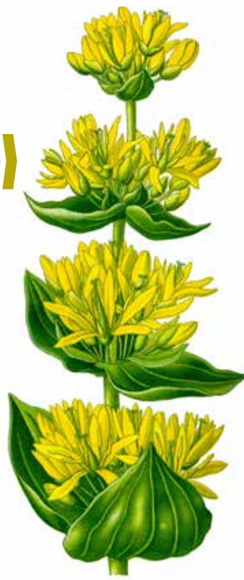
Grande gentiane jaune. Attention, ne pas la confondre avec le vératre, toxique ! Différences : chez la gentiane, les feuilles sont opposées, chez le vératre, alternes. Les fleurs de la gentiane sont jaunes, celles du vératre, d'un blanc verdâtre. Enfin la racine de la gentiane est longue et cylindrique et celle du vératre est courte, avec un rhizome épais.

La production traditionnelle par des particuliers est en régression, mais de nombreuses distilleries continuent d'en produire, notamment celle des pères chartreux à Voiron, qui commercialise un apéritif sous le nom Gentiane , qui se consomme pur ou avec de la glace, ou bien mélangé avec du cassis ou du Schweppes. La maison chambérienne Dolin en fabrique aussi sous le nom de reprise Bonal. On en fabrique également en Savoie et Haute-Savoie (Paget), dans le Massif central, et vers la Franche-Comté. C'est le Massif central qui est aujourd'hui le producteur essentiel de la plante pour distillerie. Les marques françaises les plus connues sont aujourd'hui Aimé Lebon (Le-Puy-en-Velay - Haute Loire), Avèze (Riom-ès-Montagne - Cantal), Bonal (Chambéry - Savoie), Chantelune (Aveyron), Couderc (Aurillac - Cantal), Fourche du Diable (Aurillac - Cantal), Salers (Turenne - Corrèze), Suze (historiquement Maison-Alfort dans le Val-de-Marne, aujourd'hui Thuir dans