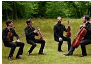
Le quatuor Bela

Judi 13 juin Modane, salle des fêtes à 20h Théâtre : atelier Arcanes jeunes