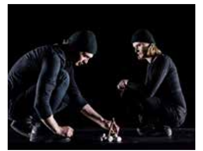
En attendant le Petit Poucet, Les veilleurs