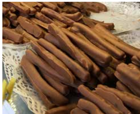
B.C. ... des orangettes, citronnettes et autres délices chocolatés.