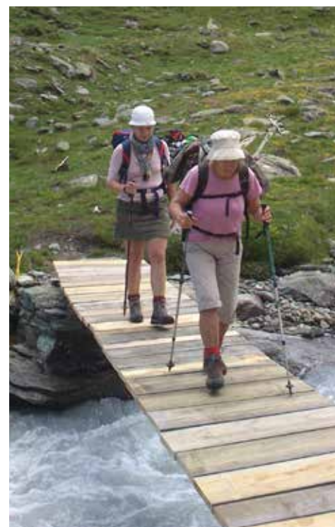
Deux premières randonneuses, en confiance...

Le titre est un clin d'œil à la chanson de Dick Rivers, adaptation du célèbre titre de John Denver Take Me Home, Country Roads . Mais... faire une passerelle pour de bon au-dessus d'un torrent de montagne reste un vœu pieu, tant les fluctuations du cours d'eau sont imprévisibles : il coule dans son lit, mais peut en sortir lors d'une crue de printemps ou lors d'un orage et balayer