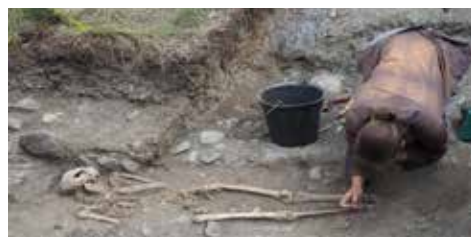
Une archéologue au chevet d'un Mauriennais vieux de... 2 000 ans ?

truite en 1947 et 1957, d'une part lors des reconstructions consécutives à la Seconde Guerre mondiale, d'autre part lors d'inondations et plus tard : en 1972 lors de travaux d'assainissement et en 1997 lors de la construction de l'office de tourisme. Les objets provenant de cette immense nécropole sont depuis dispersés dans les musées de toute la France. En conclusion de cette dernière campagne René Chemin estime que Lanslevillard fut très tôt dans l'histoire un site important lié au passage du Mont Cenis, ce qui expliquerait la présence à cet endroit de large occupations anciennes, avec leur nécropole.