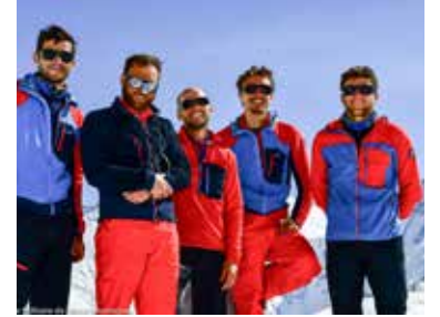
Le Groupe Militaire de Haute Montagne