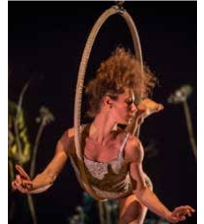
Le cirque Plume