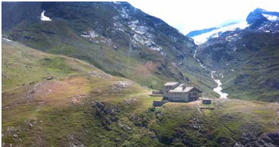
Le refuge d'Avérole (2 210 m) géré par le CAF et gardé par Sébastien Notter.

C'est un des travaux de l'été d'une longue saison d'entretien des sentiers de montagne en Haute Maurienne Vanoise : la réfection d'une passerelle qui enjambe le torrent d'Avérole, dans la vallée éponyme.