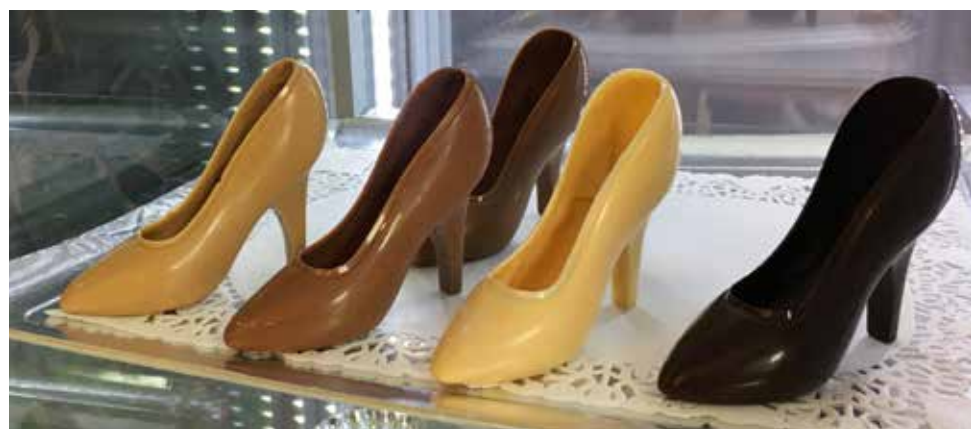
Les talons aiguilles, Aurore les aime aussi en chocolat. Stylé ! D'ailleurs, Valrhona les a remarqués sur le compte Facebook de La Montagne Chocolatée et a twitté un max sur cette création.