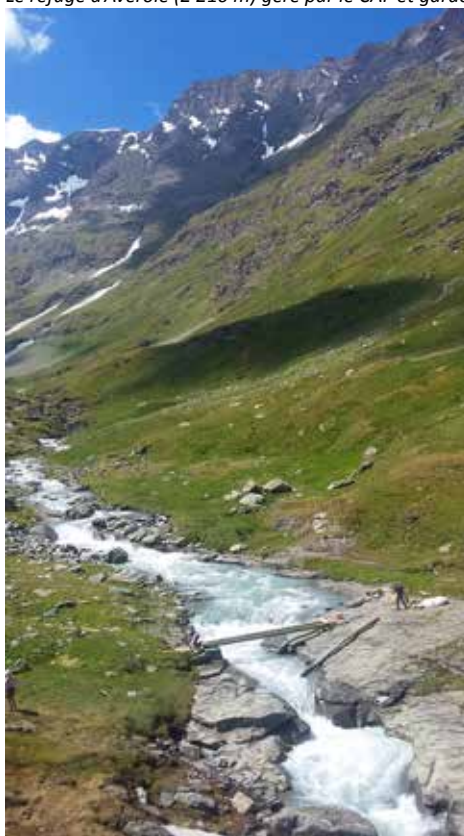
Le torrent d'Avérole, long d'une dizaine de kilomètres.