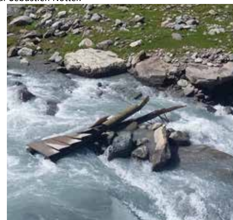
Une passerelle emportée dans le tumulte du printemps.