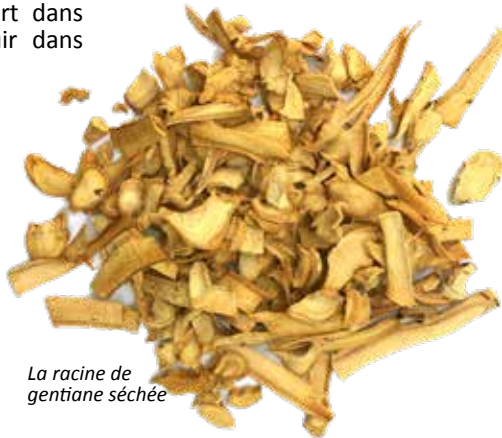
La racine de gentiane séchée