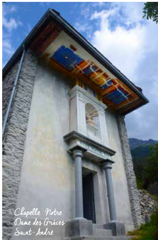
Chapelle Notre Dame des Grâces Saint-André

VAL-CENIS BRAMANS Église Notre-Dame-de-l'Assomption Sous des dehors très austères, les églises et chapelles de Haute Maurienne abritent des trésors d'art baroque où foisonnent tableaux, colonnes dorées, statues et angelots jouflus. La chapelle de la Congrégation qui rassemble des objets liturgiques de Bramans sera ouverte. Visite libre samedi et dimanche de 9h30 à 12h et de 14h à 17h. 04 79 05 10 71