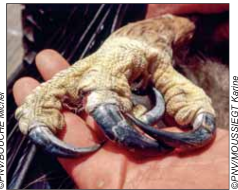
Ci-dessus à gauche, le cadavre d'un lièvre commun tué par un rapace. On voit les traces de plumes laissées par le prédateur dans la neige. A droite, le détail des serres d'un aigle retrouvé mort à Bramans. Ces serres extrêmement puissantes lui servent à tuer sa proie puis à la saisir pour l'emporter. La griffe du pouce atteint 6 à 7 centimètres de long. Un véritable poignard.