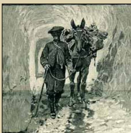
Pour circuler d'un bâtiment à l'autre, les soldats devaient déneiger les accès à la main. Quand les hauteurs de neige étaient trop importantes, il était plus simple, et plus discret, de circuler dans des tunnels.