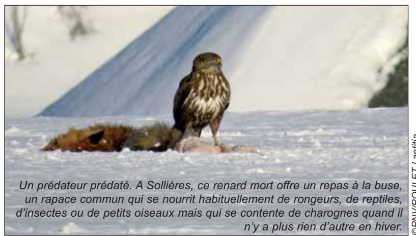
Un prédateur prédaté. A Sollières, ce renard mort offre un repas à la buse, un rapace commun qui se nourrit habituellement de rongeurs, de reptiles, d'insectes ou de petits oiseaux mais qui se contente de charognes quand il n'y a plus rien d'autre en hiver.

Pour les chiroptères (il y a de nombreuses espèces de chauves-souris en Vanoise), le régime alimentaire est basé sur les insectes (papillons, diptères) totalement absents pendant la mauvaise saison ou en trop faible densité pour nourrir des mammifères. Les chauves-souris doivent donc migrer ou hiberner dans des cavités abritées. En raison de l'altitude de la Haute Maurienne, et malgré la présence d'importantes cavités ou constructions, aucun site d'hivernage de chiroptères n'est connu sur le territoire.