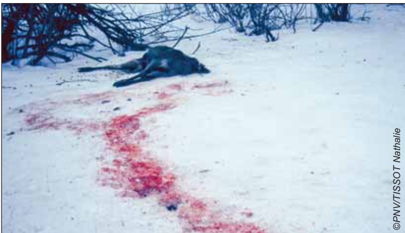
Cadavre d'un cerf près de Lanslebourg en 2006. L'animal a été attaqué par un grand prédateur (loup ou chien). Une personne a ensuite traîné l'animal pour récupérer le trophée (les bois) et un cuissot.