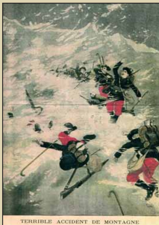
TERRIBLE ACCIDENT DE MONTAGNE

A cette altitude, le plus grand danger ne venait pas des Italiens, mais bien de la montagne.