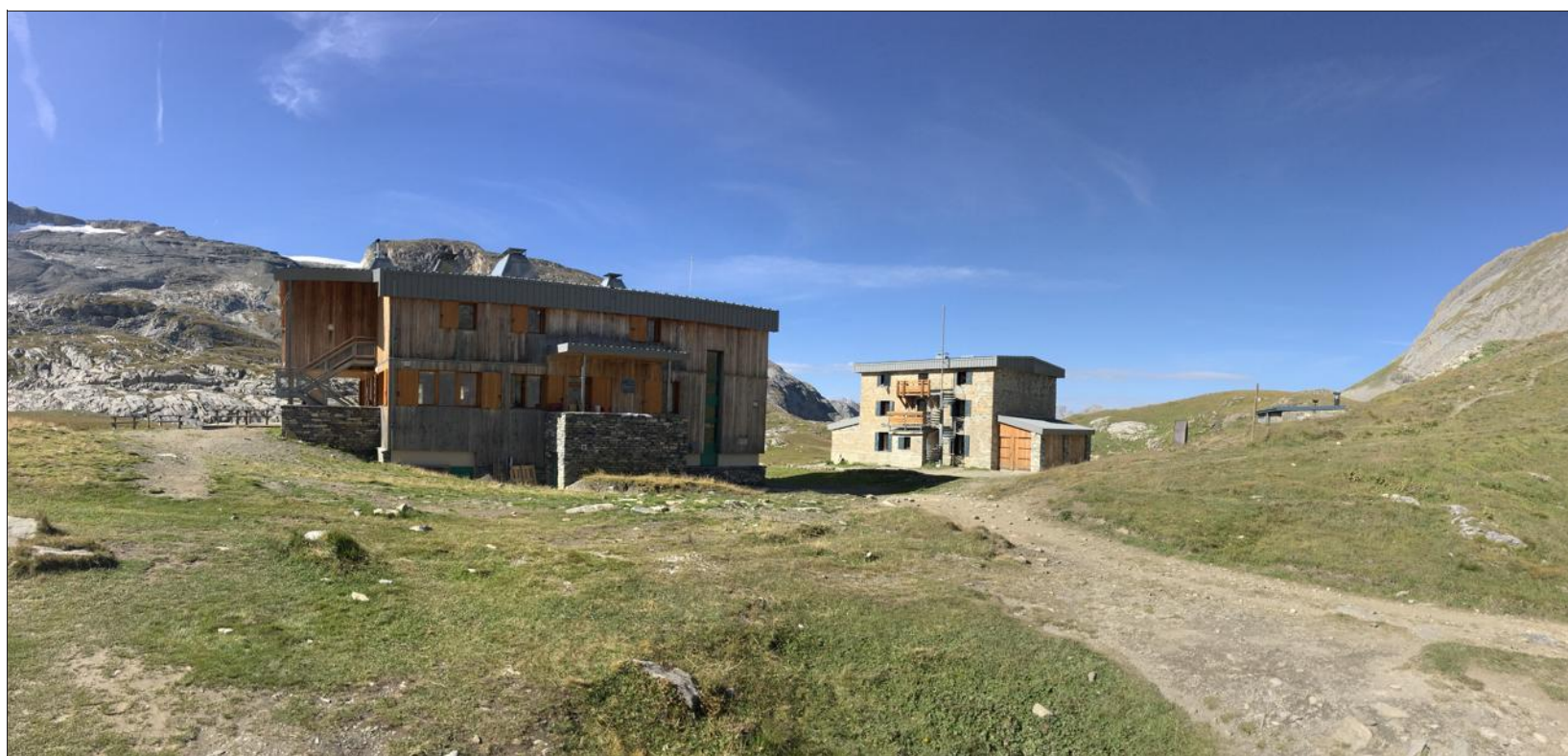
Entre le nouveau refuge de 2014 et le bâtiment historique rénové (au second plan), le site du col de la Vanoise offrira 129 couchages.

Après le nouveau refuge du col de la Vanoise (98 places), inauguré en 2014, pour succéder aux deux bâtiments modulaires au style particulier des années 70 signés Guy Rey-Millet et Jean-Prouvé, l'historique refuge Félix Faure, toujours debout, a connu une seconde jeunesse.