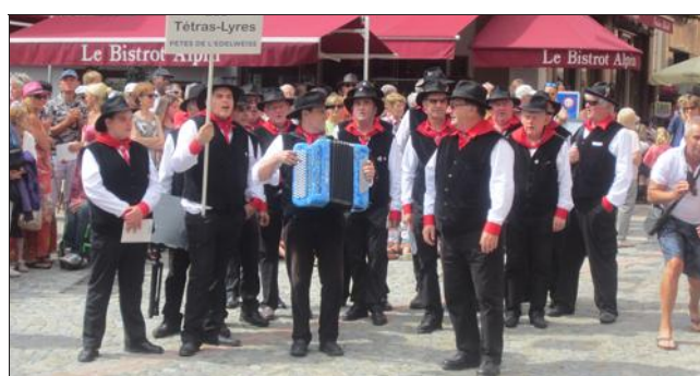
Des costumes traditionnels seront présentés lors de ce rendez-vous.

La Fête de l'edelweiss revient ce dimanche, à Bourg-Saint-Maurice. La ville résonnera au son des groupes folkloriques de montagne, dès 10 h 30. A cette occasion, il sera possible d'aller à la rencontre des groupes invités et de découvrir de nouvelles cultures à travers des chants et des danses du monde. Un Marché des traditions aura également lieu toute la journée.