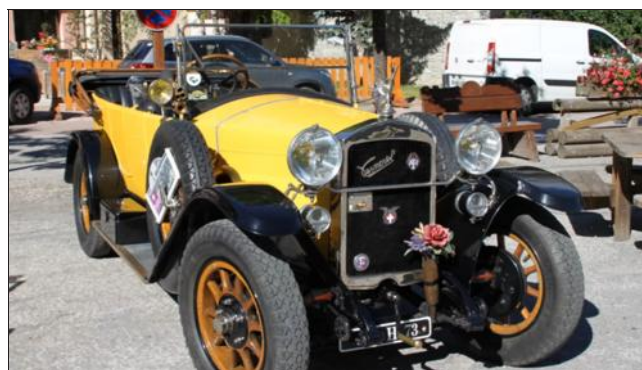
Le public pourra admirer les belles mécaniques et rencontrer leurs propriétaires.

Le 2 e rassemblement de voitures anciennes baptisé La Belle Pralognanaise passera par Bozel, ce dimanche. Après un défilé et un concours d'élégance, qui a eu lieu samedi à Pralognan, les voitures feront une halte sur le parking situé près du lac. Les belles mécaniques prendront ensuite la route de Brides-les-Bains.