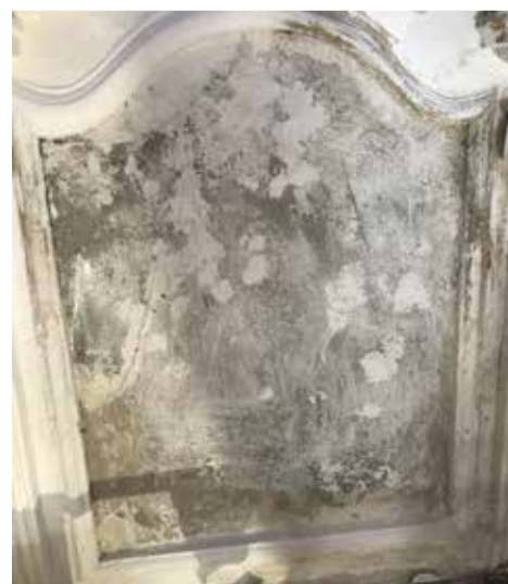
Ici reviendra le tableau du baptême du Christ.