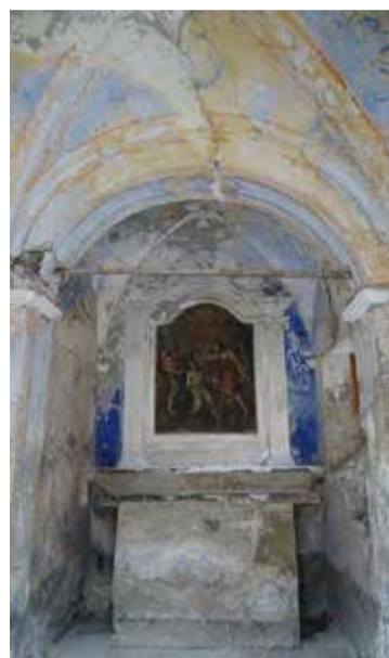
Vues intérieures, avant les travaux.