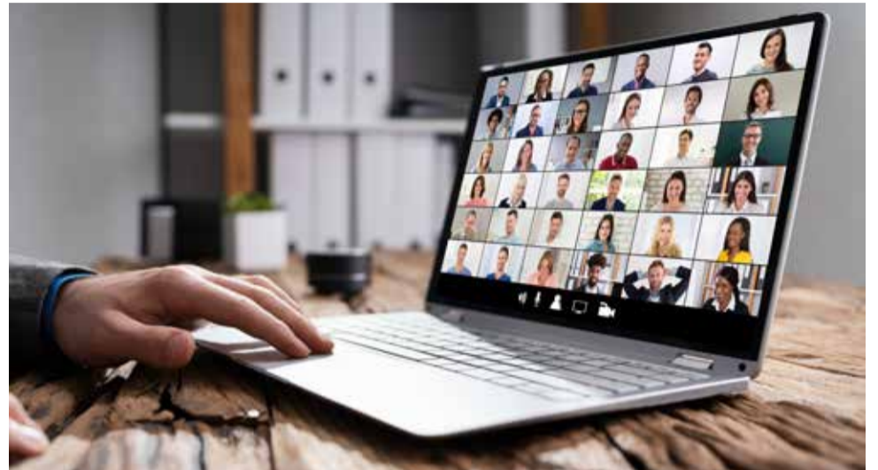
Deux images symboles de notre temps. La crise sanitaire a vu le télétravail de masse émerger, avec utilisation d'outils numériques pour tenir des réunions à distance. On ne se voit plus en « présentiel », on fait des « visioconférences », des « webinaires »... La digitalisation des rapports sociaux progresse toujours plus, à l'inverse du lien social véritable, rencontre physique, sensorielle et vivante entre des personnes, qui se délite. La dématérialisation touche à grande échelle les services publics, ceux de l'Etat et des grandes administrations en particulier : les guichets physiques ferment les uns après les autres et se retrouvent, dépersonnalisés, sur Internet. Les intercommunalités y pallient par le biais notamment des MSAP (Maison de Service Au Public) dans lesquelles elles mobilisent des agents. Il est clair que la crise sanitaire et son cortège de mesures restrictives (confinement, état d'urgence, couvre-feu pour tout le monde, isolement pour les personnes âgées) favorisent le délitement du lien social. Conséquence : des études montrent aujourd'hui que le stress mental qui en découle peut conduire à des formes de dépression, à des troubles psychiques ou psychiatriques voire à la maladie mentale, preuve que le lien social participe pleinement de la santé des individus. La rupture ou la désagrégation des liens sociaux frappent d'abord les plus faibles : les personnes déjà isolées et/ou les plus pauvres, les personnes âgées mais aussi les adolescents et les jeunes adultes. B.C.

Depuis plusieurs décennies, par le prisme des Sciences sociales le thème de la crise du lien social a été exploré et analysé à partir d'une étiologie d'ordre politique, économique, social et psychologique. La crise sanitaire actuelle consécutive à la pandémie provoquée par le coronavirus n'échappe pas à cette réalité. En effet, cette pandémie n'est pas