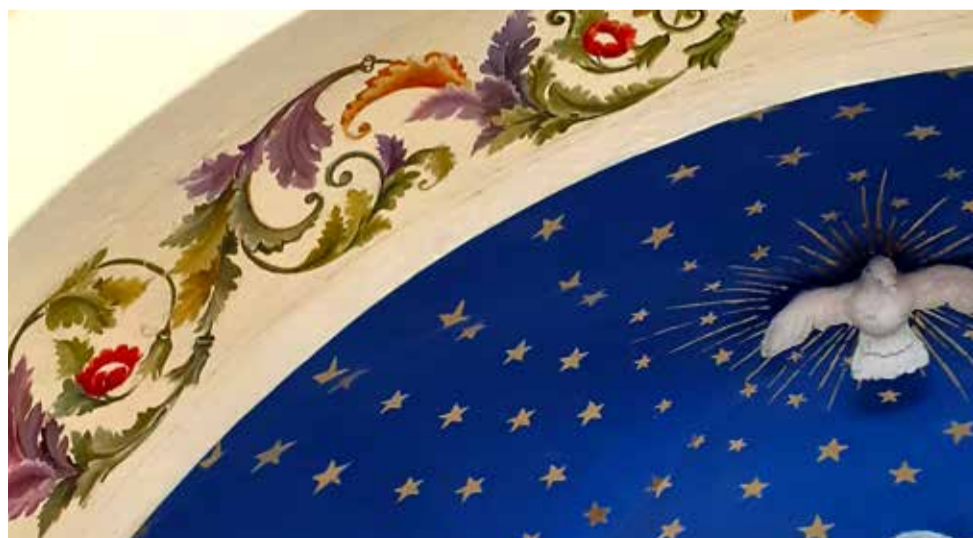
Colombe au faite de la voûte et moulure avec angelot en cours de restauration.