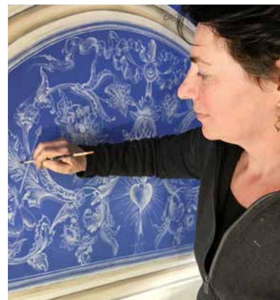
Armelle Filliol a peint les grisailles sur ce joli fond bleu.