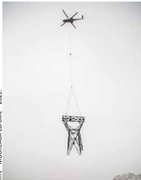
RTE - MOUREAUX Caroline - 2021.

Le 3 mars dernier, sur le site des Moulins, RTE a procédé au démontage d'une ligne électrique aérienne à 63 KV. La société gestionnaire du Réseau de Transport d'Électricité français (RTE) a réalisé cette opération afin de libérer les espaces nécessaires au chantier du Lyon-Turin et de préparer l'alimentation électrique des futurs tunneliers, qui perceront le tunnel de base du Mont-Cenis. Une nouvelle ligne souterraine a été mise en service à cet effet début 2021. Les 8 pylônes de la ligne ont été démontés grâce à des hélicoptères gros porteur évitant ainsi la construction de pistes pour accéder aux pylônes par camion. L'installation du chantier des puits de ventilation d'Avrieux, dont les déblais seront entreposés sur le site des Moulins et des Tierces, se poursuit pour accueillir dès cet été les Raise boring machine issues de l'industrie minière, qui perceront les 4 puits verticaux de 500 mètres jusqu'au pied de la descenterie de Villarodin-Bourget/Modane.