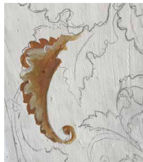
Feuille d'acanthe en cours de création.