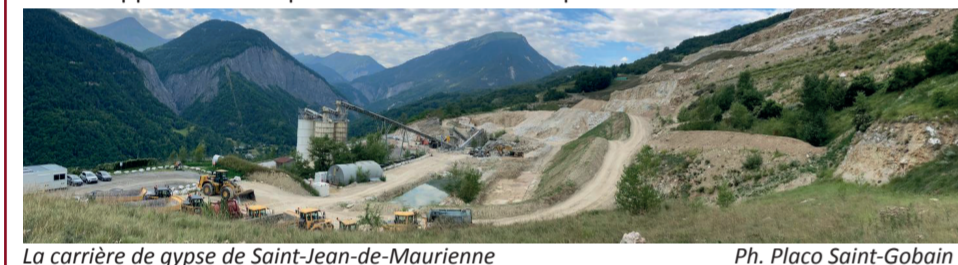
La carrière de gypse de Saint-Jean-de-Maurienne

L'épuisement des ressources, la quête de nouveaux gisements La société PlacoPlâtre (Groupe Saint-Gobain) a alerté les ministres de l'Environnement et de l'Industrie sur les difficultés d'approvisionnement de son usine de plaques de plâtre de Chambéry (157 personnes), suite à l'épuisement du gisement exploité par la société Gypse de Maurienne (SOGYMA) à Saint-Jean-de-Maurienne et Saint-Pancrace. Cette carrière alimente en gypse l'usine PlacoPlâtre de Chambéry depuis 1981, mais également pour une moindre part des cimenteries Vicat en Isère et dans l'Allier. PlacoPlâtre Chambéry est considérée comme stratégique en France, elle est la deuxième usine de fabrication de produits d'isolation et du second œuvre pour le bâtiment en France, avec une production annuelle de 45 millions de m² de plaques de plâtre, l'équivalent de plus de 150 000 logements neufs. Selon les années, cette usine consomme entre 300 et 450 000 t de gypse par an. Elle est approvisionnée par train directement depuis la carrière de St-Jean-de-Maurienne