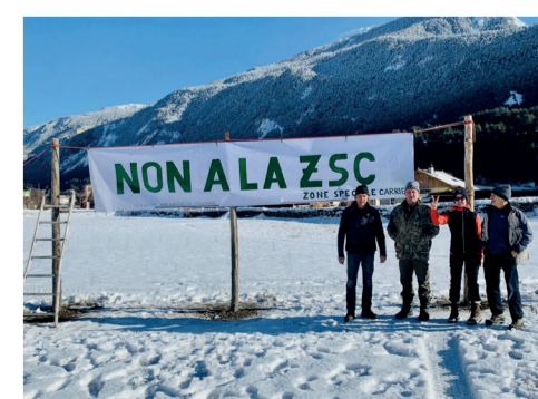
Sur le terrain, ici à Bramans, le non est également sans équivoque.

« On ne peut pas tout concentrer sur un seul espace de montagne, une seule vallée. Car c'est bien ce qu'il se passe aujourd'hui. »