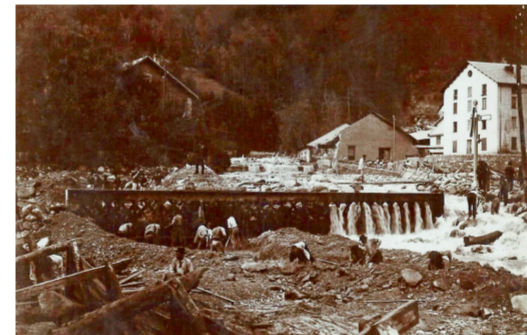
Fourneaux, inondations 1906