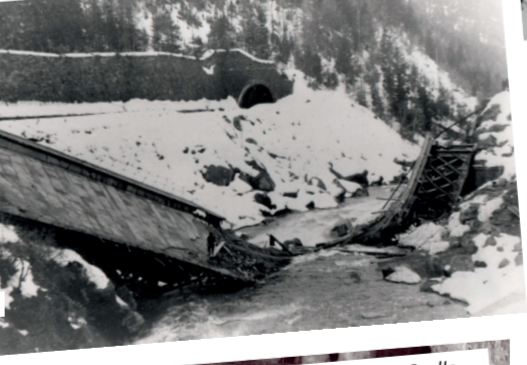
Ci-dessus, les ponts détruits d'Argentine, Orelle Prémont et St-Michel-de-Maurienne La Saussaz