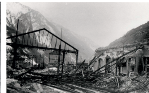
La gare de Modane après les bombardements de 1943 et bâtiments provisoires 1945-1955