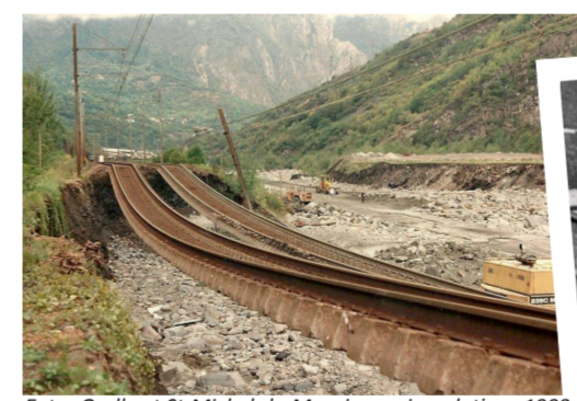
Entre Orelle et St-Michel-de-Maurienne, inondations 1993