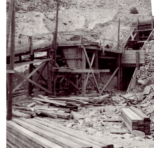
Travaux de reconstruction du tunnel ferroviaire du Mont-Cenis 1945 - 1946