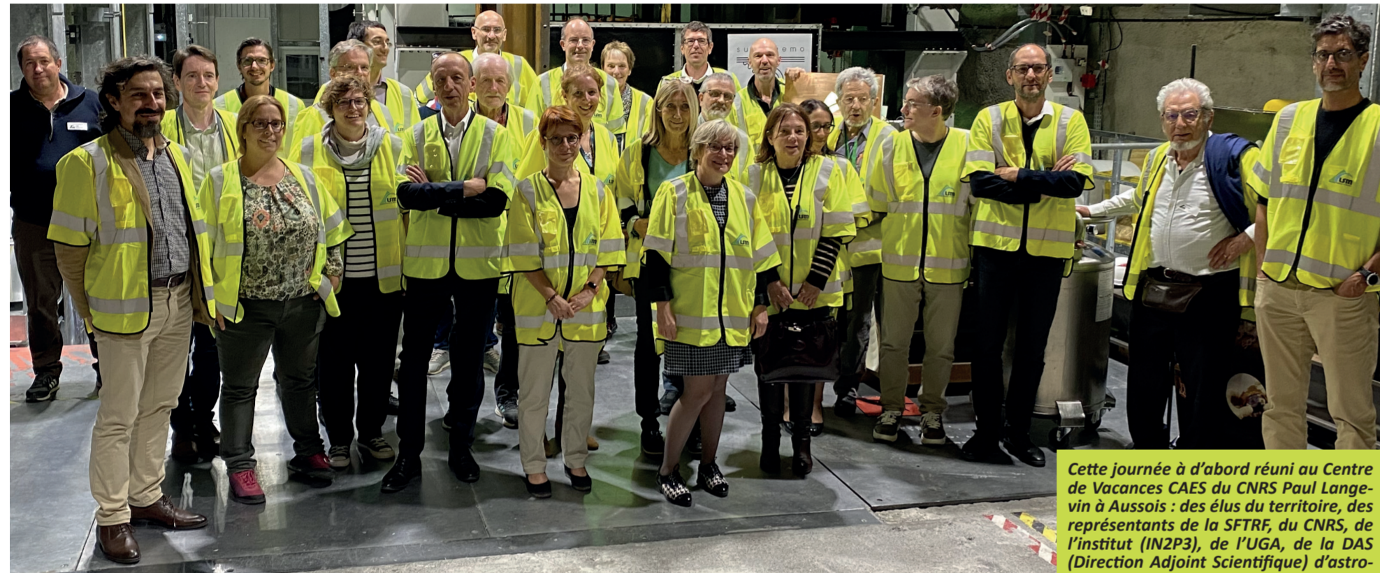
Cette journée a d'abord réuni au Centre de Vacances CAES du CNRS Paul Langevin à Aussois : des élus du territoire, des représentants de la SFTRF, du CNRS, de l'Institut (IN2P3), de l'UGA, de la DAS (Direction Adjointe Scientifique) d'astrophysique d'IN2P3, du laboratoire LPSC, LSM, mais aussi les anciens directeurs du LSM, le directeur scientifique actuel du LSM, des directeurs d'autres laboratoires d'IN2P3, les chercheurs référents des expériences installées au LSM, les chercheurs du LPSC LSM, le personnel du LSM. L'après-midi, une partie de ces personnes se sont retrouvées au laboratoire niché dans le tunnel du Fréjus, pour une visite commentée.

Le 17 octobre dernier, pour fêter dignement cet anniversaire, le LSM a rassemblé les directions de ses tutelles scientifiques et universitaires (CNRS, UGA et Grenoble_INP) au CAES du CNRS à Aussois, puis au laboratoire souterrain, au cœur du tunnel du Fréjus.