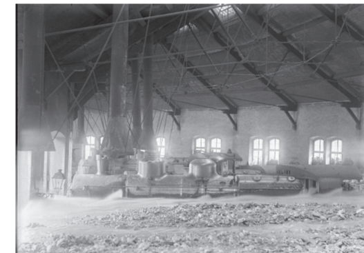
Modane, rotonde, inondations, 1915.