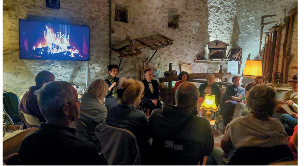
► Spectacle « Victor Victus Cabaret Pop » le jeudi 23 mai à 20h à la Salle Fabrice Melquiot à Modane ► Atelier de la Chorale kilométrique tout

public le samedi 4 mai et restitution sur le Chemin du Petit Bonheur le dimanche 5 mai.